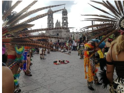
Fest in Zapopan