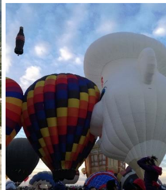
Festival del Globo (Leon)