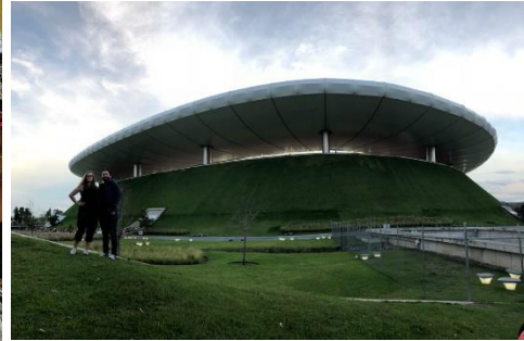
Fussballstadion (von Chivas)