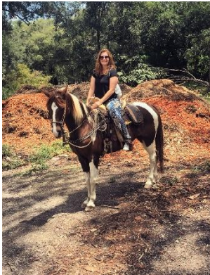
Bosque de colomos

– mexikanisch, europäisch, US-amerikanisch etc. – sehen und beobachten können. Es war die Erfahrung definitiv wert.