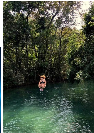
Puente de dios - Huasteca