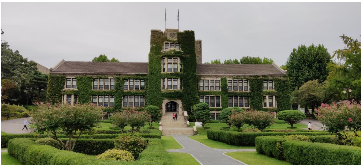
Yonsei Altbau im Underwood Courtyard