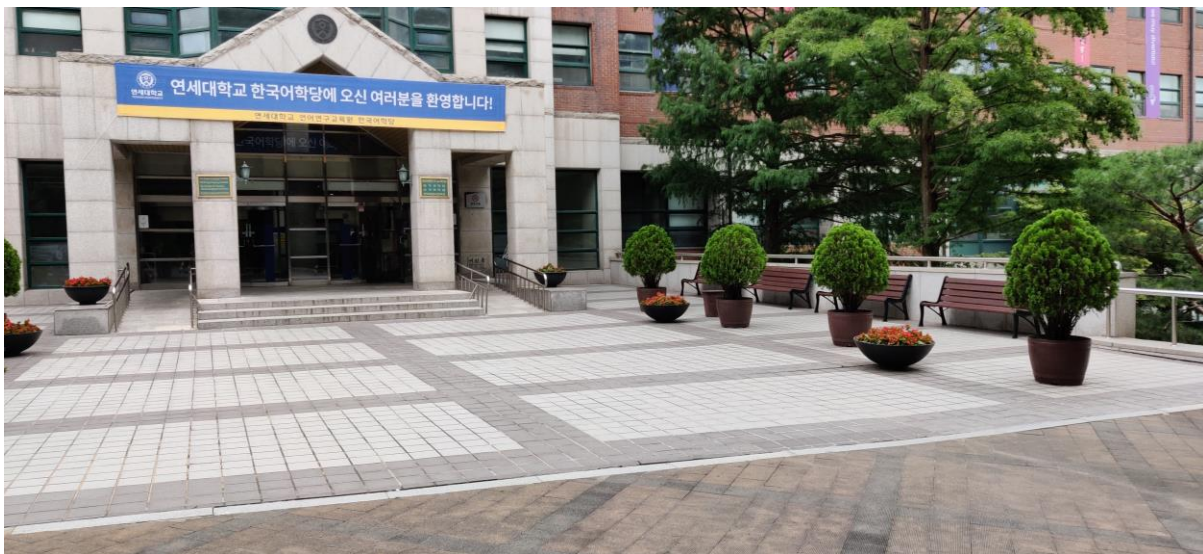
Eingangsbereich des Korean Language Institutes (KLI)

Ich habe den „normalen“ Sprachkurs gemacht und kann es jedem weiterempfehlen. Der Stoff ist nicht übermäßig anspruchsvoll und macht ziemlich viel Spaß. Die Klassen bestehen nur aus 10 – 12 Leuten, mit denen man sich ziemlich schnell anfreundet, da man sich jeden Tag sieht. Der Koreanisch-Kurs war definitiv eine der besten Erfahrungen, die ich an der Yonsei University gemacht habe.