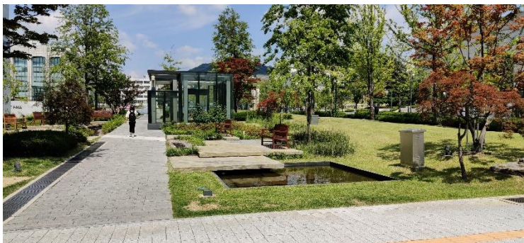
Yonsei-Campus im Sommer