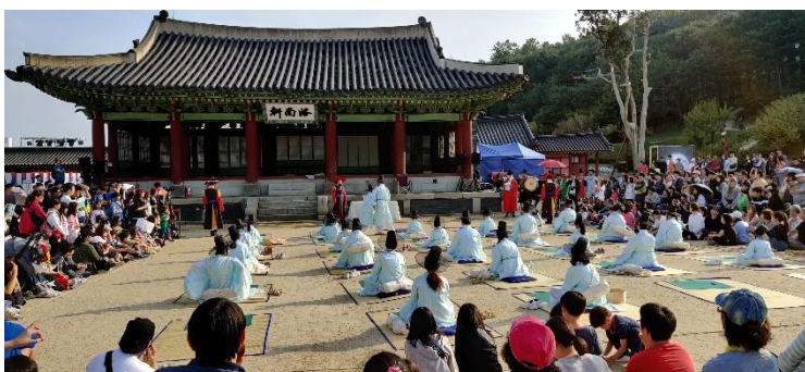
Darbietung eines klassischen koreanischen Schauspiels während des Kultur-festivals in Suwon