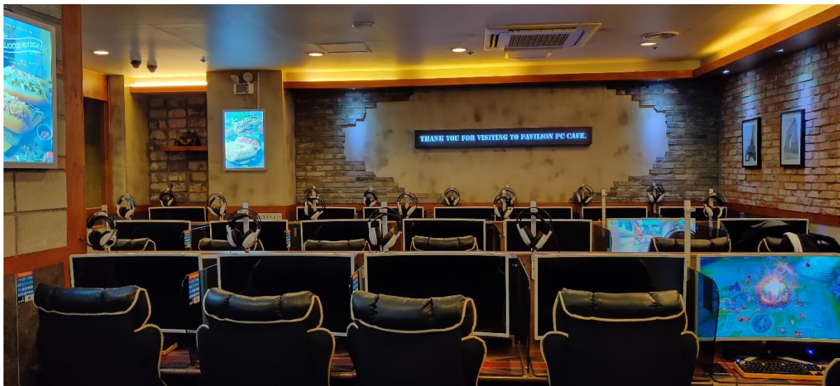
PC-Bang in Sinchon, Seoul (신촌)

Wer lieber etwas Aufregenderes machen möchte kann sich in der Unterhaltungsbranche von Seoul voll ausleben. Es gibt Karaoke, Arcades mit allen möglichen Spielen von Dart bis hin zu Dance Dance Revolution und Einrichtungen, wo man Sport wie Golf, Tennis oder Baseball spielen kann. Für Leute, die gerne Video-Spiele konsumieren, gibt es besonders viel Auswahl. Zum einen gibt es Clubs, die Virtual-Reality-Spiele anbieten und wer lieber an einem klassischen PC sitzt, kann sich rund um die Uhr in den PC-Bangs vergnügen, die in ganz Seoul verteilt sind.