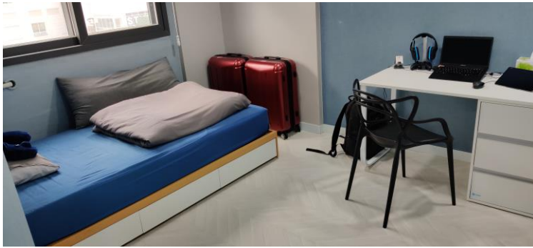
Mein Zimmer im 42Share-Wohnheim