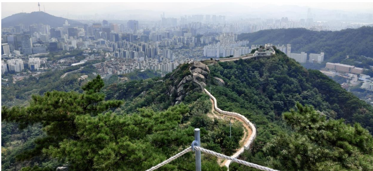
Blick auf Seoul vom Berg „Inhwangsan“ (인왕산)

Ich habe mich recht schnell für Korea als Zielland entschieden, nachdem ich die Partneruniversitäten der LUH gesichtet und mit den Regionalkoordinatoren gesprochen habe. Die Universitäten in Korea bieten interessante Kurse an, haben ein gutes Niveau und genießen exzellente Reputationen. Außerdem finde ich die koreanische Sprache äußerst faszinierend und war sehr motiviert auch vor Beginn des Semesters schon so viel wie möglich von der Sprache zu lernen.