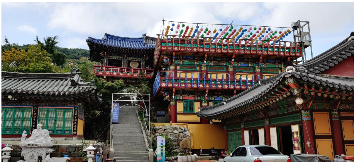
Buddhistischer Tempel in Suwon (수원)

Für die Wegplanung mit den Öffis kann ich die App ‚Kakao Maps‘ empfehlen und wer detaillierte Informationen zu den Fahrplänen haben will, sollte sich die Apps ‚Kakao Bus‘ und ‚Kakao Metro‘ herunterladen.