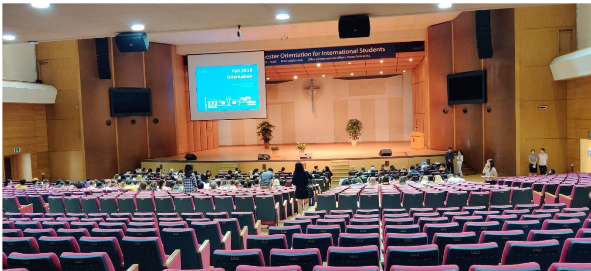
Einführungsveranstaltung für int. Studenten (30 Minuten vor Beginn)

Die Einführungsveranstaltung gibt einen Überblick über das Campusleben, die organisatorischen Strukturen und die Studentenclubs, die sich speziell an internationale Studenten richten. Nach der mehrstündigen Präsentation ist die Einführung dann auch schon wieder vorbei. Allerdings wird man am Ende noch mit dem Handbuch „Study Abroad at Yonsei“ ausgestattet, welches alle möglichen wichtigen Termine, Orte, Kontaktdaten und Links enthält, die man im Laufe des Semesters brauchen könnte.