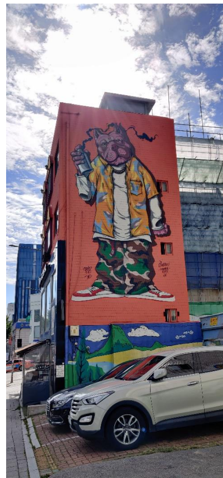
Graffiti in Seoul