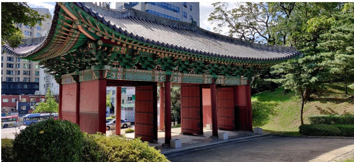
Eingangstor zum Palast Gyeonghuigung (경희궁)

Langzeit-Auslandskrankenversicherungen sind ein schwieriges Thema, wenn man einen optimalen Schutz für einen möglichst kleinen Preis sucht. Ich habe meine Versicherung beim ADAC abgeschlossen und dort für 7 Monate ca. 250€ gezahlt. Die Auswahl ist ziemlich groß, aber es ist nicht immer einfach an detaillierte Informationen zu den Versicherungsplänen zu kommen. Im Allgemeinen kann ich nur den Tipp geben: Lasst euch Zeit beim Vergleichen verschiedener Versicherungsanbieter. Preise und Leistungen variieren sehr stark und die investierte Zeit wird sich definitiv rentieren.